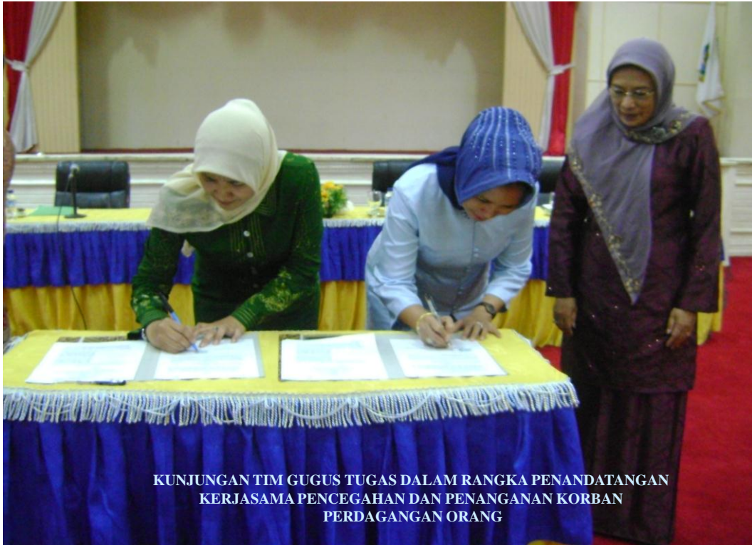
KUNJUNGAN TIM GUGUS TUGAS DALAM RANGKA PENANDATANGAN KERJASAMA PENCEGAHAN DAN PENANGANAN KORBAN PERDAGANGAN ORANG