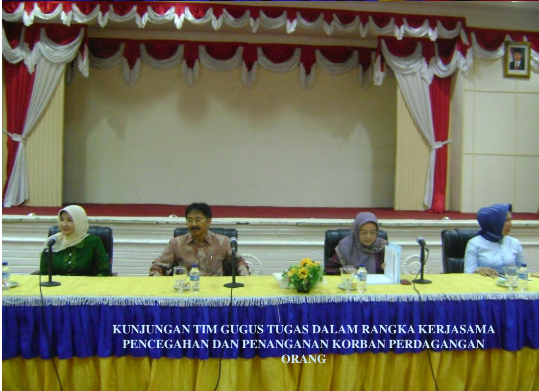
KUNJUNGAN TIM GUGUS TUGAS DALAM RANGKA KERJASAMA PENCEGAHAN DAN PENANGANAN KORBAN PERDAGANGAN ORANG